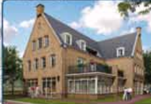
Kop Varsenerstraat (start bouw Apotheek + 5 appartementen)