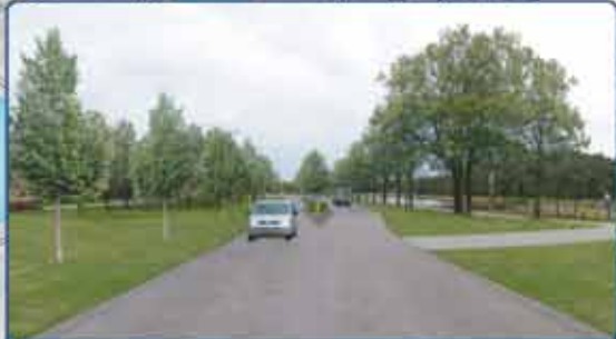
Herinrichting Varsenerdijk 2013 gerealiseerd