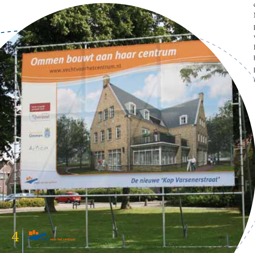
Ⓞ Het bouwbord 'Ommen bouwt aan haar centrum'

Het Marktgebouw levert een stevige bijdrage aan het toekomstige karakter van dit gebied. “De Markt is straks aan drie kanten bebouwd. De vierde zijde is open en legt door het fraaie uitzicht de verbinding met de Vecht. Op die manier worden het centrum en de rivier echt met elkaar verbonden. De Markt wordt straks de ‘huiskamer van Ommen’. De komende periode gaan we het ontwerp van het Marktplein verder uitwerken, samen met betrokken inwoners en ondernemers.” Binnen het ‘rondje Ommen’ speelt het 11 Aprilplein een belangrijke rol. Jarenlang was dit een tamelijk klein parkeerterrein met uitzicht op de achterkanten van winkels, maar daarvan is straks weinig terug te zien. Hier verschijnt het gebouw De Vrijheid, met winkelruimte op de benedenverdieping en woonruimte op de eerste etage. “Het is natuurlijk niet aan ons om te bepalen welk soort winkels hier komen, maar we kunnen ons voorstellen dat hier een paar leuke boetiekjes of andere kleine winkels komen.” De woningen zijn allemaal verkocht en als de winkelruimte ingevuld is, start ontwikkelaar Artica in 2014 ook hier met de bouw.