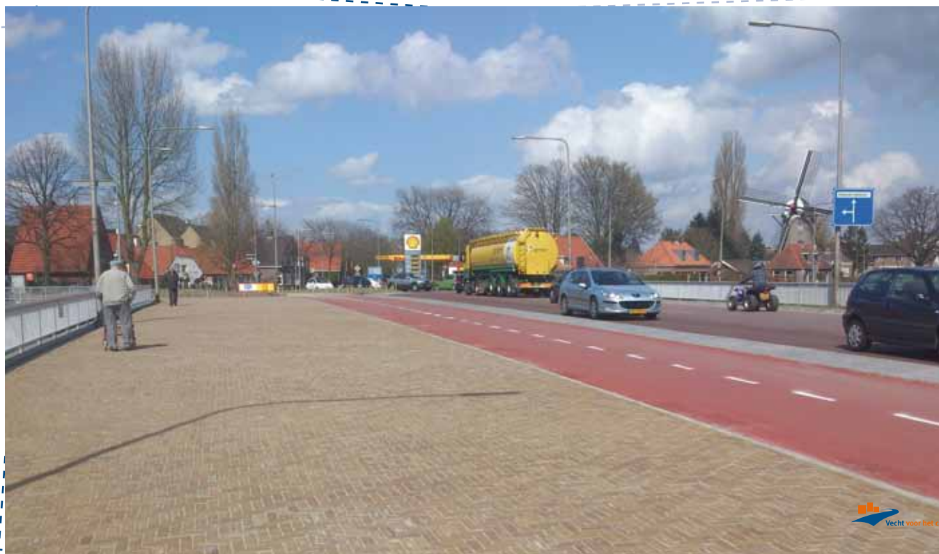
📍 De Hessel Mulertbrug

Om dit rondje aantrekkelijk te maken, dient het gebied volgens Ekkelenkamp nog wel wat mooier ‘aangekleed’ te worden. “Als je de brug en daarmee Ommen Zuid beter bij het centrum wilt betrekken, moet het bijvoorbeeld aantrekkelijk zijn om er rond te lopen. Daarom gaan we onder meer bankjes plaatsen en de brug een andere kleur geven. Hij wordt grijsbruin, want dat past beter bij de natuurlijke omgeving van de Vecht. Op deze manier wordt het gebied een eenheid en dat zorgt voor extra kwaliteit van het centrum.”