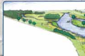
Impressie herinrichting Vecht start uitvoering eind 2013/b