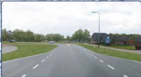
Herinrichting kruising Danteweg/Varsendijk